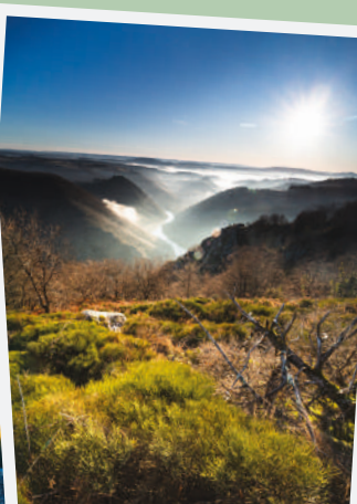
Panorama de Fombillou