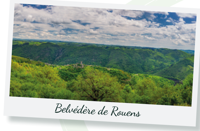
Belvédère de Rouens

Prenez de la hauteur et laissez-vous surprendre par les paysages des Terres d'Aveyron en pleine renaissance. Vallées verdoyantes, lumières douces et points de vue spectaculaires : le printemps se vit grand angle !