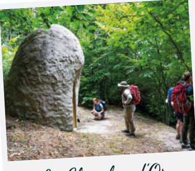
La Chambre d'Or

Empruntez un tronçon du mythique GR@65 et marchez au rythme de la nature XXL. Entre patrimoine, rencontres et paysages apaisants, l'aventure commence ici... vous êtes déjà ailleurs.