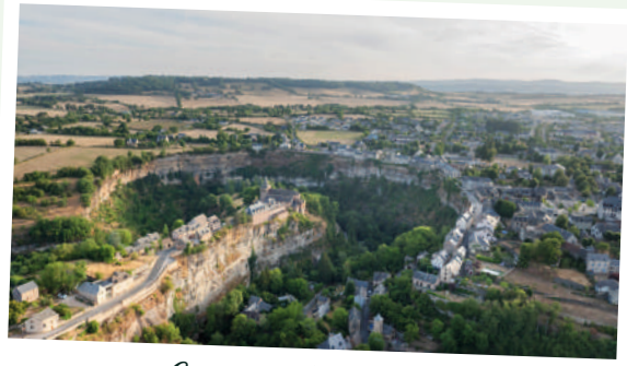
Canyon de Bozouls

Tyrolienne au-dessus du vide ou pause face au panorama : au Canyon de Bozouls , chacun trouve son frisson. Explorez les sentiers qui longent les falaises et découvrez ce cirque naturel unique façonné par le temps.