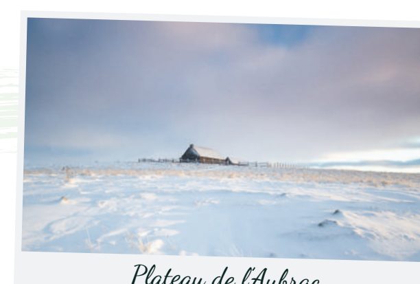
Plateau de l'Aubrac

Rencontrez nos artisans passionnés aux créations uniques et savoir-faire authentiques. Le souvenir parfait ? Celui qui a une histoire à raconter.