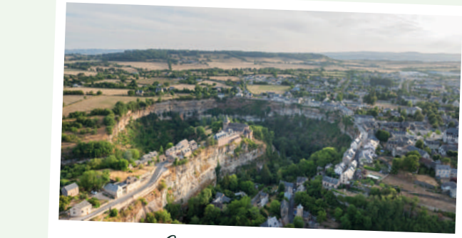
Canyon de Bozouls

Coupez les lumières, levez les yeux... et laissez la magie opérer. Un ciel pur , des étoiles par milliers : émerveillement garanti. À partager en famille ou entre amis.