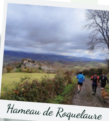
Hameau de Roqueleure