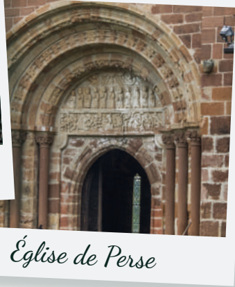
Église de Perse